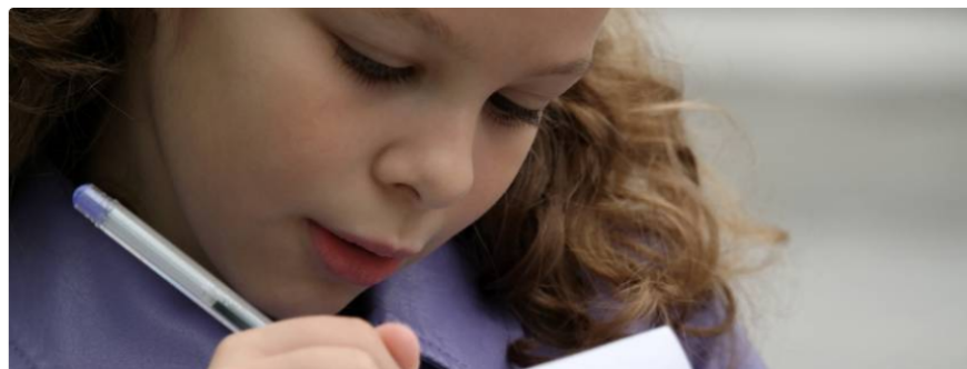
7. März 2018 - von Marion Breiter-O'Donovan - in (Schatzkammer), Bildung & Förderung, Erziehung